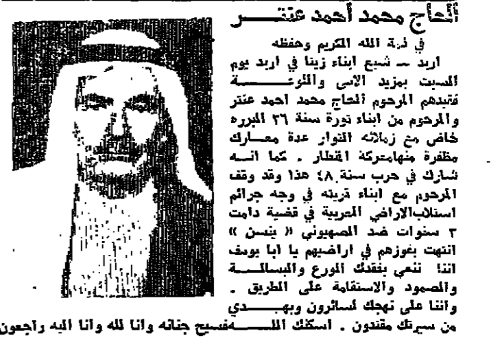
أخراج محمد أحمد عنتسر